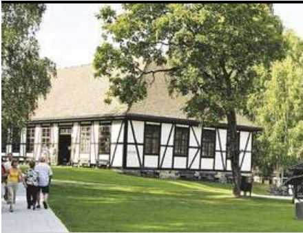
Blaafarverket ved Modum byr på både klassiske gjengangere og nyere verk. Temaet er blåfargene i kunsten.