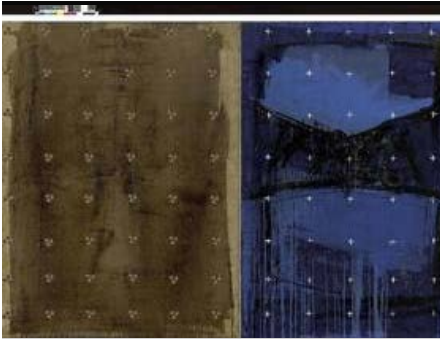
Kjell Nupen: Stille natt. Hellige natt 1994-95. kan sees på Blaafarverket fra 9.mai.