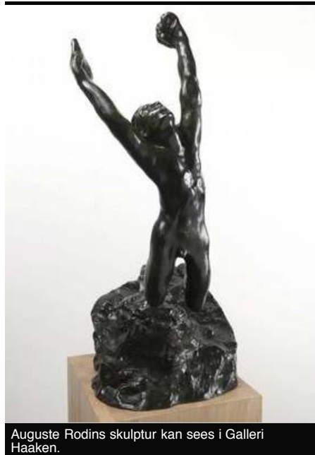
Auguste Rodins skulptur kan sees i Galleri Haaken.