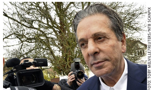
CHARLES SAATCHI [70]