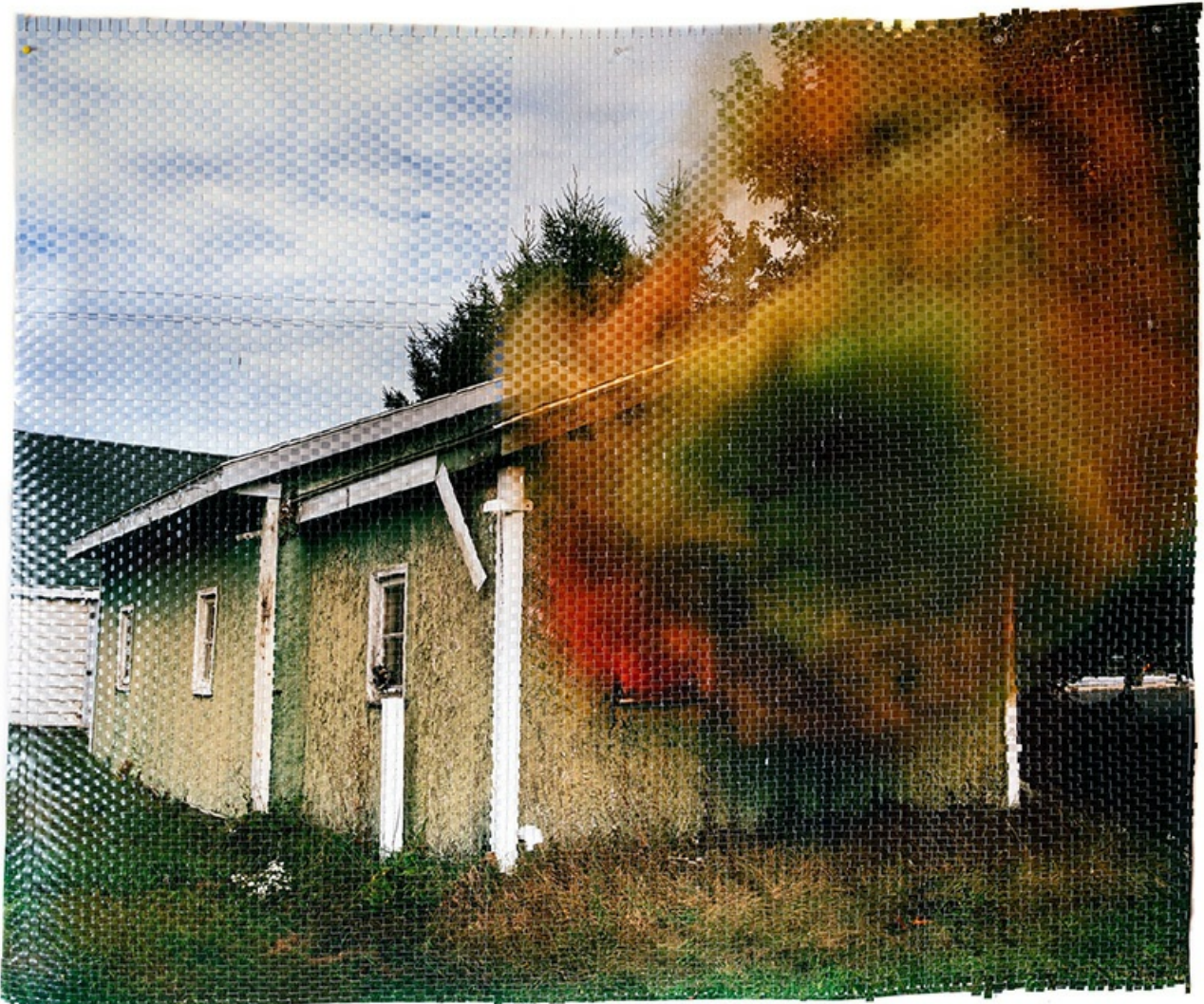
Last Breath , 2020 Impresión de pigmento de archivo tejido a mano, 149 x 125 cm

Este impulso disruptivo, así como un compromiso físico profundo con los materiales artísticos y el proceso creativo, son esenciales para la práctica de Kyle Meyer . Para The Pit Deep Down Inside, El Hoyo en el Fondo el artista cavó un agujero de 2.5 metros para quemar varios objetos. Abriendo el ángulo de visión, el espectador divisa esta pira brillante frente a una tranquila escena pastoral, que representa la supresión de la emoción y el conflicto.