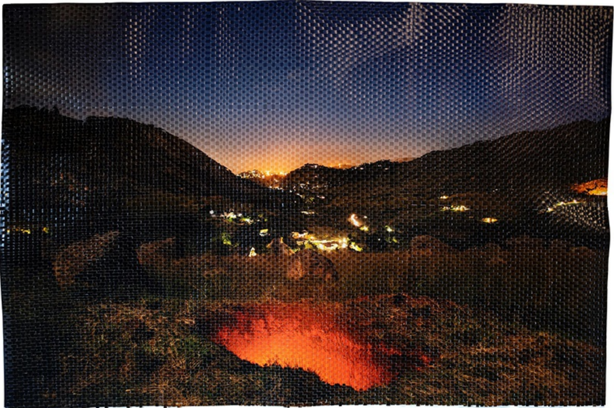
The Pit Deep Down Inside , 2020 Impresión de pigmento de archivo tejida a mano, 123 x 184 cm

Estoy llamando la atención sobre algo que nunca se habría visto antes