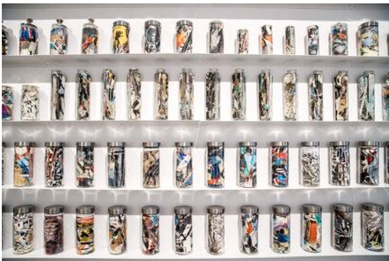
'Las Urnas', obra de André Elbaz incluida en 'Trilogía marroquí', la primera exposición del año en el Museo Reina Sofía.

Estos dos momentos en la obra de Elbaz —el compromiso político y la ruptura postmoderna con el pasado— ilustran la muestra Trilogía marroquí , en el Museo Reina Sofía de Madrid: más de 250 piezas y documentos de archivo producidos desde la independencia, en 1956, hasta nuestros días. La exposición se divide en tres periodos históricos (1956-1969, 1970-1999 y 2000-2020). “Nunca antes había tenido lugar una genealogía del arte moderno de Marruecos, ni tan siquiera en su propio país”, asegura Manuel Borja-Villel , director del centro, en una de las 22 salas del Edificio Sabatini que acogen la propuesta. “Tratamos de visibilizar procesos y experiencias ligadas a la periferia historiográfica. Si antes nos centramos en América Latina, este es el momento de unos vecinos del sur sobre los que sabemos poco. Sin embargo, ellos conocen bien a los creadores occidentales”, prosigue.